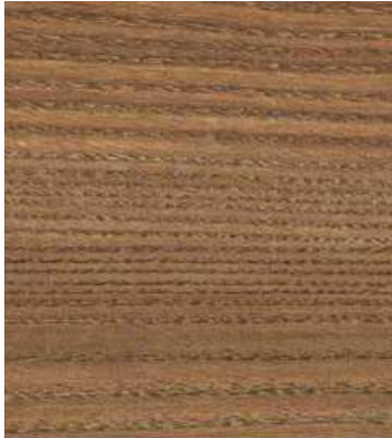
No1215 ブラウンカッシーナアッシュ