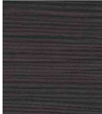
No3081 アシエンダーブラック