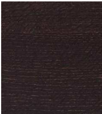
No3370 ブラウンムーランドオーク