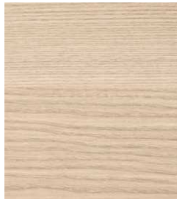
No1298 サンドナシアッシュ