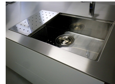
製作シンカー一体型SUSHLカウンター と水切りプレート(オリジナル)