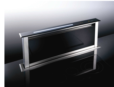
ダウンドラフトベンチレーション Lift90(伊Best社) 定価 ¥486,000税込み