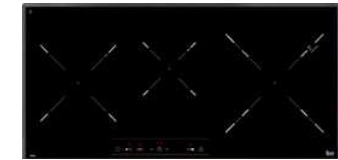
3口IHコンロ IR831.2(独Teka社) 定価 ¥ 313,200税込み