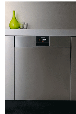
食器洗い機 DI 250 460 (独ガゲナウ社) 定価 ¥505,440税込み